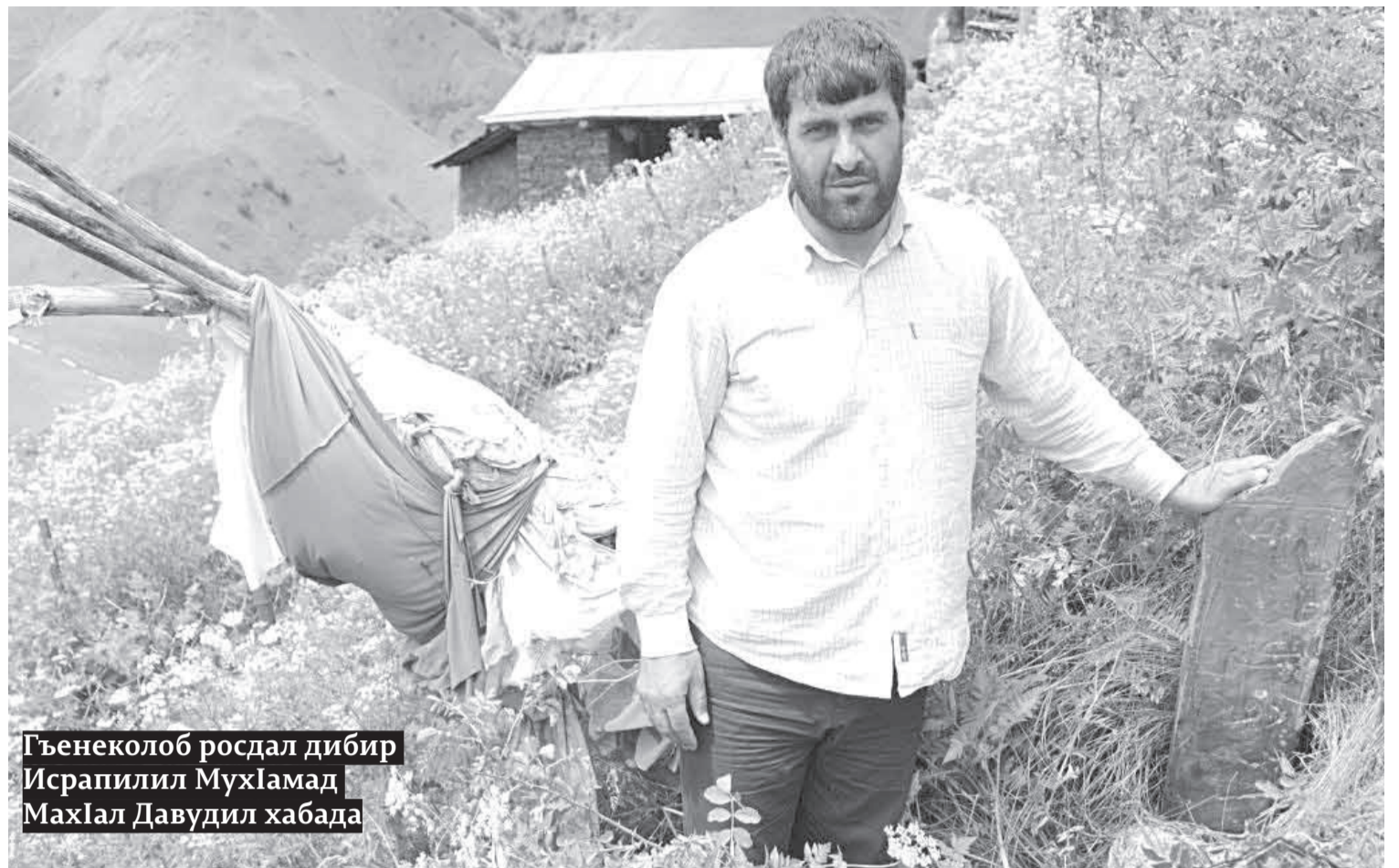
Гъенеколос росдал дибир Исрапилил Мухлмамд Махлал Давудил хабада

Чурмуталгун байбихъуда ислам тибитиялгун иш гъажаибаб